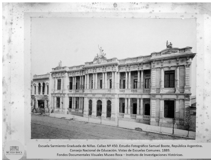
Escuela Sarmiento Graduada de Niñas. Callao Nº 450. Estudio Fotográfico Samuel Boote, República Argentina. Consejo Nacional de Educación. Vistas de Escuelas Comunes. 1889. Fondos Documentales Visuales Museo Roca – Instituto de Investigaciones Históricas.

La sede de la Escuela Sarmiento destaca como uno de los “palacios del saber” edificados por la generación del 80 para resaltar la significación valiosa de la educación pública, gratuita y laica.